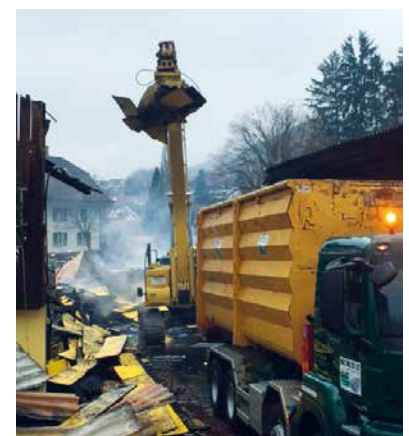
Brandherde öffnen mit Materialverlad