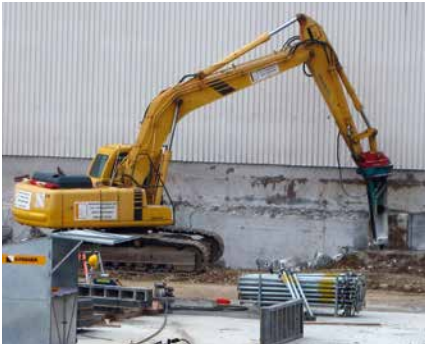
Baumaschineneinsatz mit hydr. Abbauhammer

Fachspezialisten für Erdbewegungen, Tiefbau, Rückbau, Recycling und Entsorgung, Transporte, Deponien, Reinigung und Saugeinsätze stehen innert kürzester Zeit zur Verfügung.